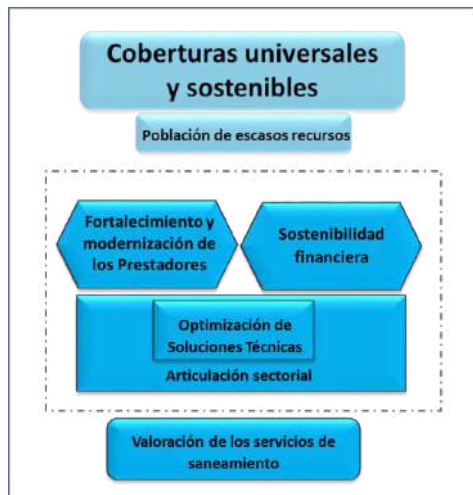
Gráfico N° 2 Esquema de la Política Nacional